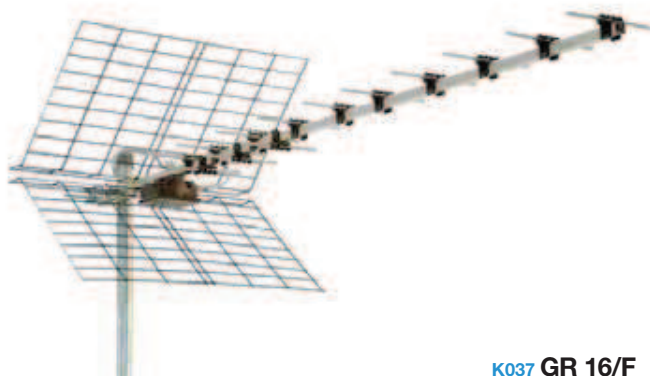
K037 GR 16/F