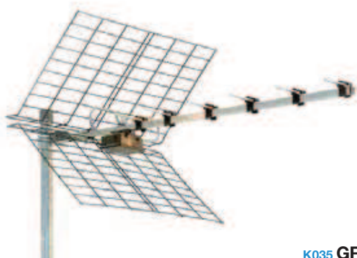
K035 GR 9/F